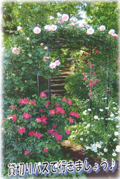
貸切りバスで行きましょう♪

いつもご参加下さる方も、初めて参加の方も♪ ken-showのバスツアーをお申込み下さり