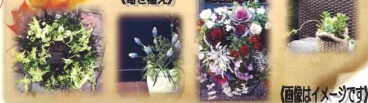
(画像はイメージです)